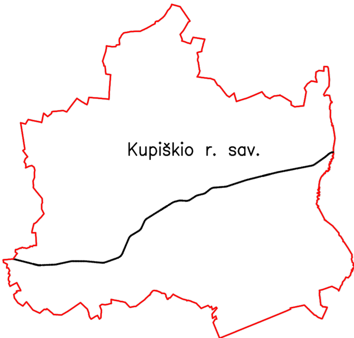
1 pav. Geležinkelio kelių tinklas Kupiškio r. savivaldybėje

Kupiškio r. savivaldybės teritorijoje esamos viešosios geležinkelių infrastruktūros kelių ilgis siekia 50,860 km. AB „LTG Infra“ patikėjimo teise valdo 9 viešųjų geležinkelio kelių objektų, jų duomenys pateikiami 1 priede.