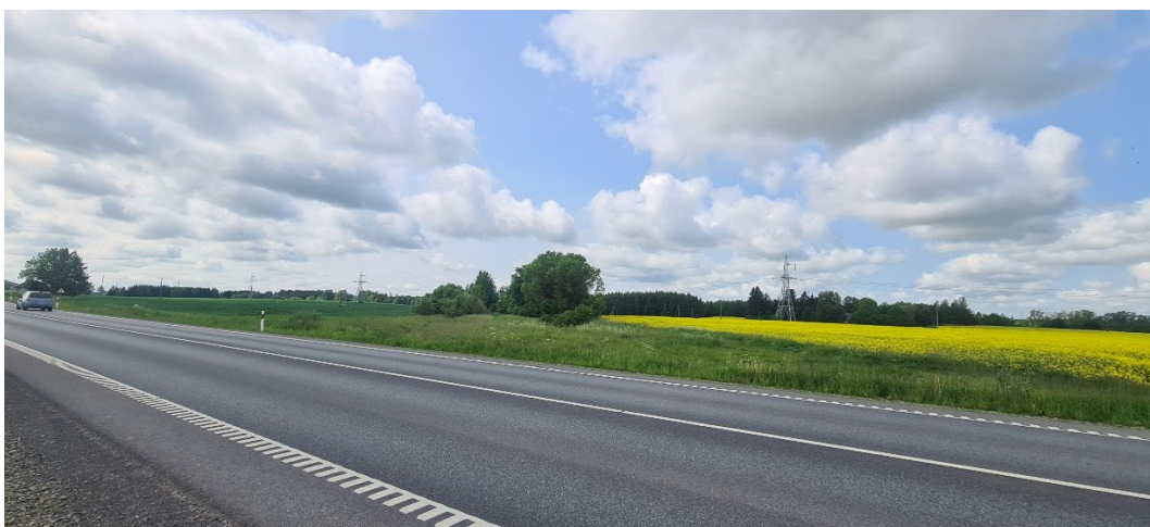
6. Papyvesių kaime magistralę kertantis siaurojo geležinkelio komplekso (21898) Panevėžio – Biržų ruožas iš šiaurės rytų.