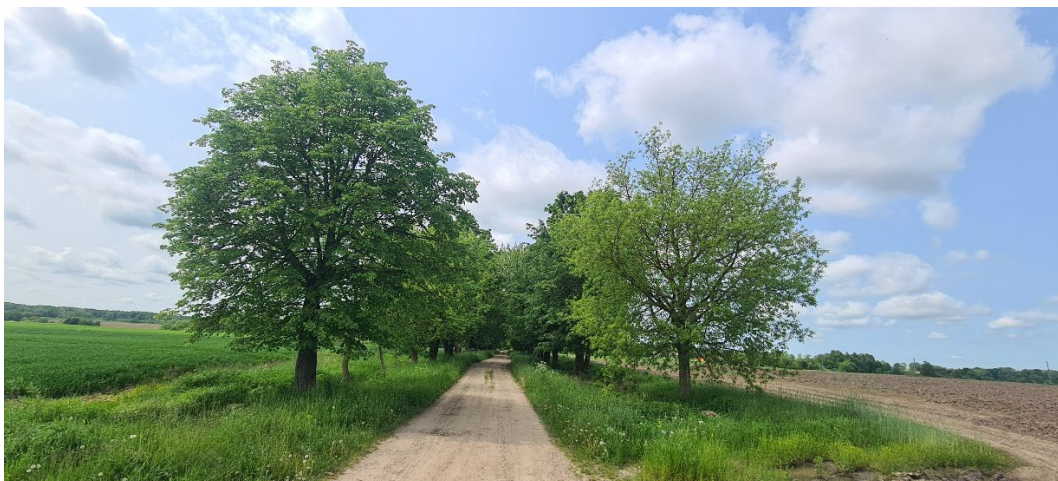
4. Raudonpamūšės dvaro (433) alėjos dalis iš rytų.