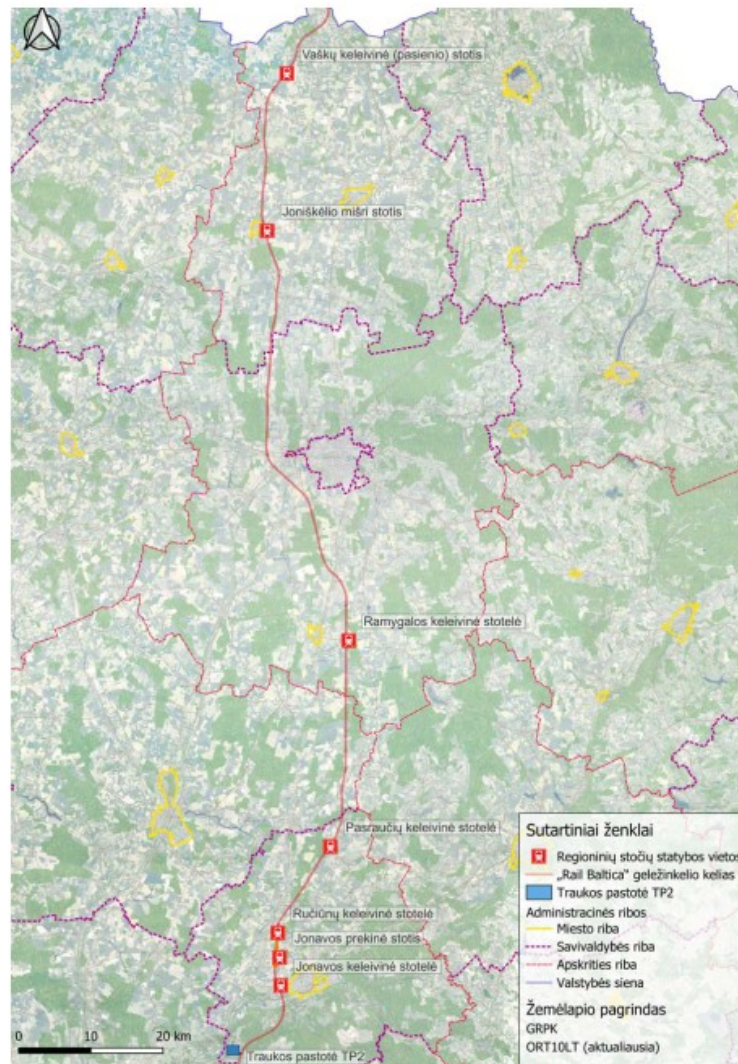
1 pav. Regioninių stočių statybos vietos