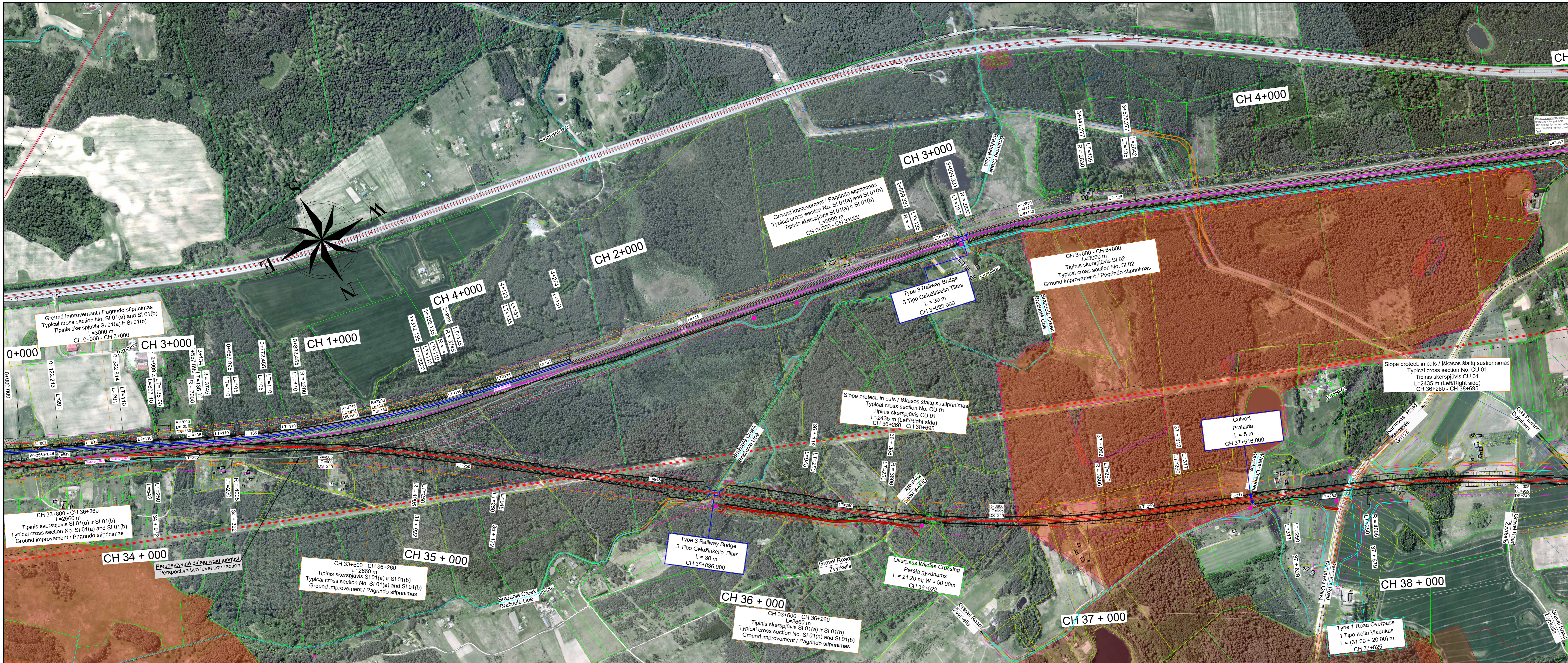
Layout plan / Keli išd stymo planas Scale / Mastelis 1:5000